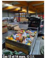
Ces 13 et 14 mars.

Marchin, Clavier, Modave ou encore Huy. « Les louveteaux sont allés expliquer l'opération à leurs camarades de classe, pour les inviter à amener des vivres à l'école. On aime attribuer un rôle responsabilisant à nos amis. Le staff d'unité est allé récolter tout ça dans les écoles ce lundi avec deux remorques », explique l'animatrice-responsable. Avec un total de 160 animés, 26 animateurs et 5 membres du staff d'unité, l'unité scout de VyleMarchin est un mouvement de jeunesse qui tourne à plein régime. Pourtant, les jeunes ne bénéficient pas de locaux dignes de ce nom. « On dispose de deux containers derrière l'école. Chemin de Sandron. On a interpellé la commune car c'est très compliqué. Deux containers pour 160 animés, c'est la catastrophe quand il pleut ».