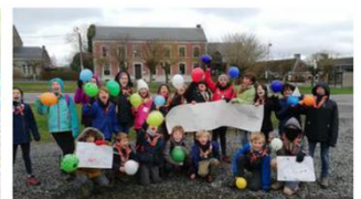
Ces 13 et 14 mars avait lieu l'opération Arc-en-Ciel.